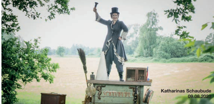
Katharinas Schaubude 09.08.2023