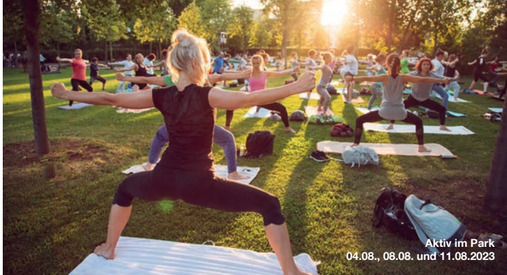
Aktiv im Park 04.08., 08.08. und 11.08.2023